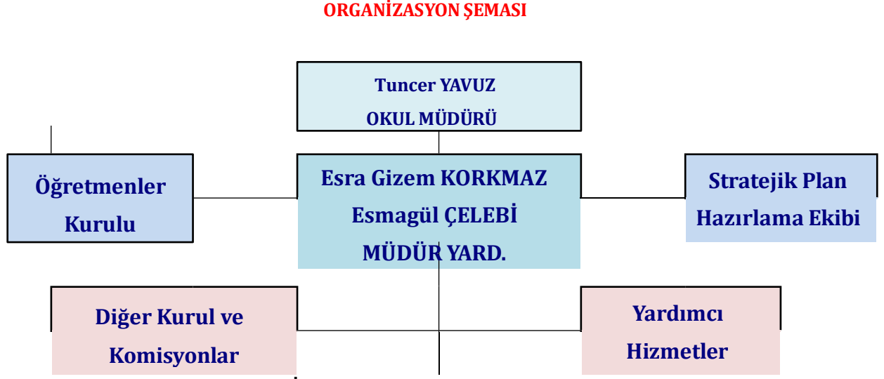
ŞEKİL. 1 Yönetim Organizasyon Şeması